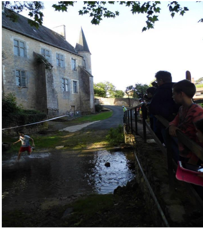
Nous terminons par le gué !!